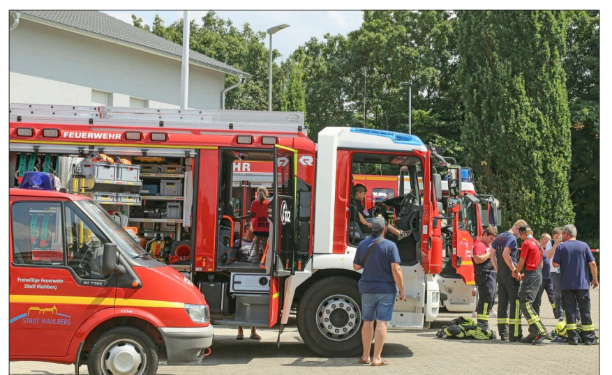
Der Fuhrpark der Feuerwehr konnte besichtigt werden.

Absoluter kulinarischer Renner war der frisch erfundene „Mohlburger“ mit derart vielen Einlagen von Käse, Schinken, Salat,