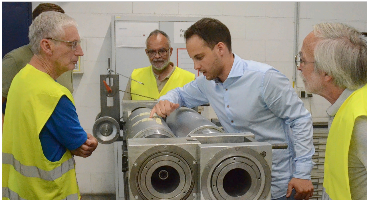
Interessiert lassen sich die Leserinnen und Leser die Feinheiten der Prägungen auf den Walzen erklären.

Die Firma Janoschka gehört zu den weltweit führenden Partnern der Druckvorstufe für die Verpackungsdruckindustrie im Bereich Konsumgüter, erklärt Geiger den Besuchern. Die Produktpalette bietet unter anderem Druckformen für