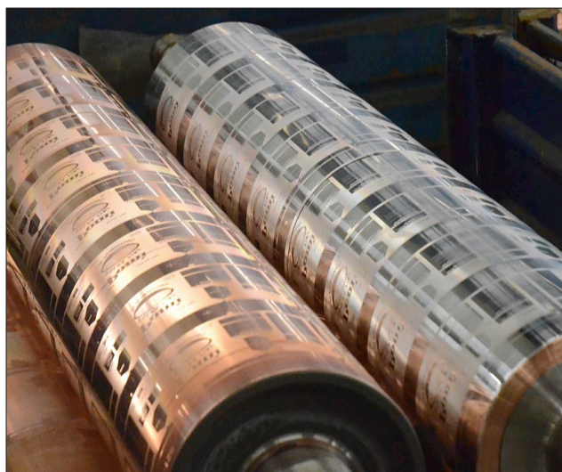
Frisch geprägte Walzen warten auf die Abholung (links), ganz wichtig ist auch die Endkontrolle des Probedrucks, denn Fehler in der Prägung könnten für die Firma Janoschka teuer werden.

► Eine Fotogalerie gibt es online unter https://mehr.bz/fotos-janoschka